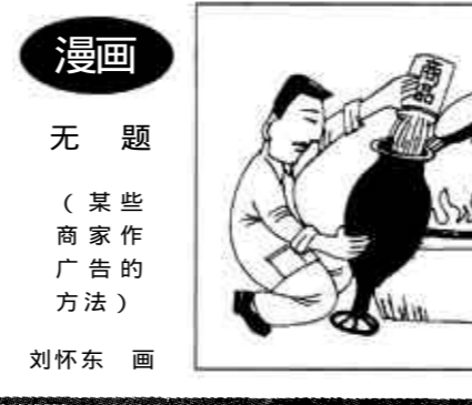
漫画 无题 (某些商家广告的方法) 刘怀东画