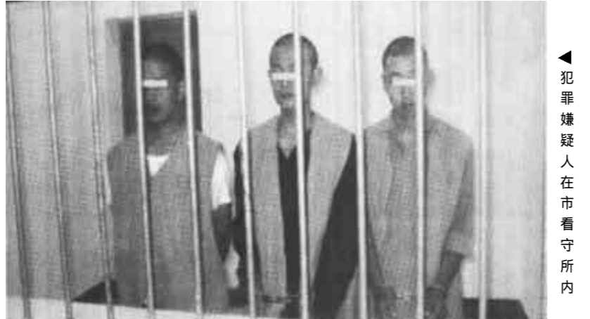
犯嫌疑人在市看守所