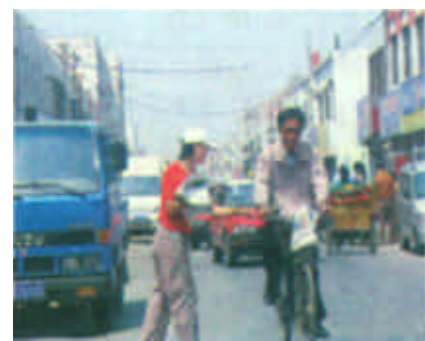
图中这位商家的雇员，乱发广告单，不仅影响了狭窄的高河路交通，还造成了弃纸乱飞，影响了市容环境。（开言 摄）

大，被查处后，为逃避严厉处罚，表面上态度诚恳，可过后易地继续进行扩大生产，不曾想又让质监人员逮了个正着。他拿出上一次行政处罚书的目的是以为执法人员已经处罚了一次了，这次说说话就能免了，但他没想到给予他的却是更为严厉的处罚。（记者 田召斌 通讯员 高力 顾海军）