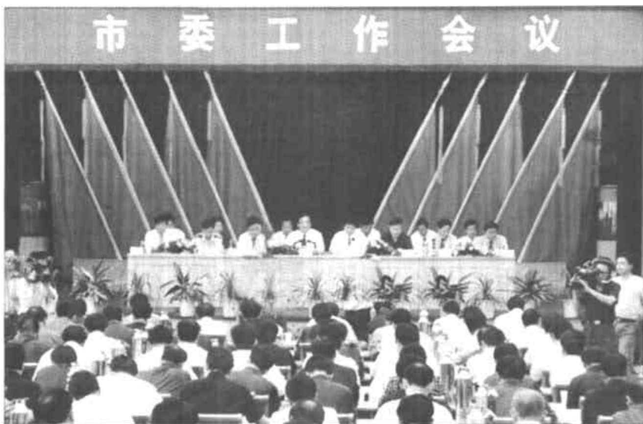
本报讯 6月10日下午，市委工作会议在东营宾馆隆重召开。

这次会议，主要是贯彻落实省八届五次全委会议和省委工作会议精神，学习借鉴苏、浙、沪等先进地区的经验，进一步动员全市广大党员干部群众，再掀解放思想的新高潮，再谋加快发展