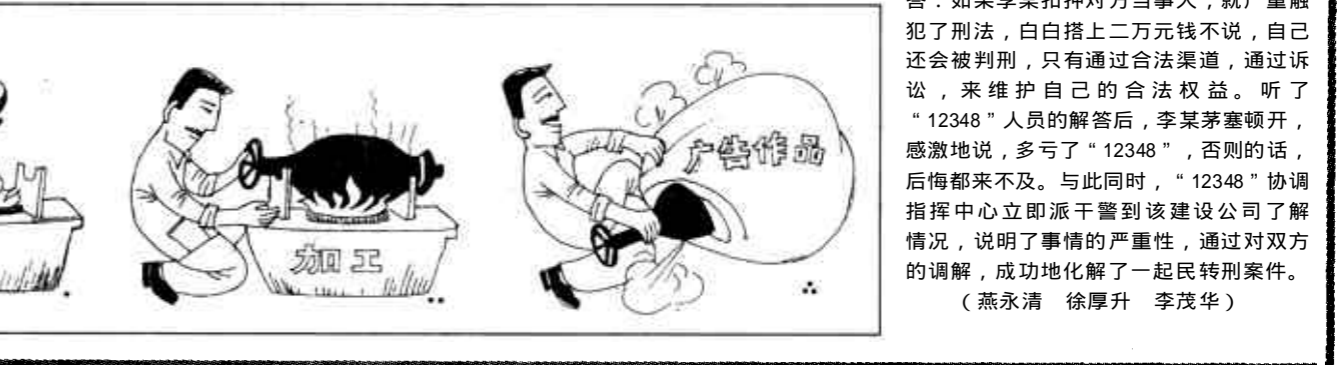
漫画 无题 (某些商家广告的方法) 刘怀东画