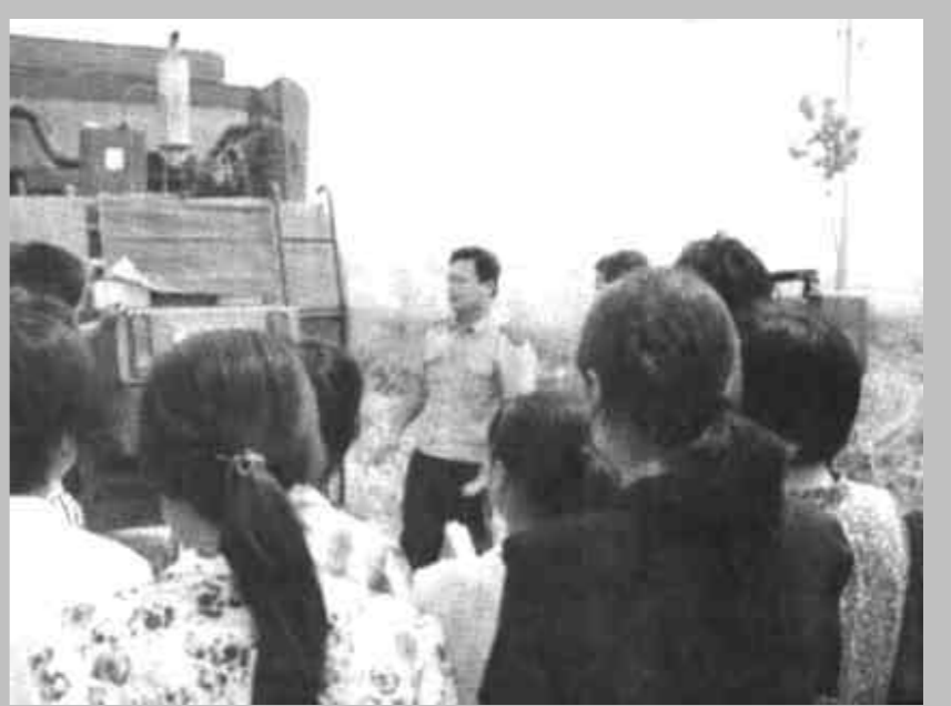
为切实做好麦收期间的消防安全工作，日前，广饶县消防大队工作人员走上田间地头现场办起了消防安全知识培训班，向广大农民宣传麦收期间、焚烧麦茬等行为的危害，还对100多名农机人员系统地讲解了农机引发火灾的各种原因和预防措施，并与每一名农机操作人员签订了《麦收防火安全责任状》。